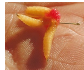
An den Haken kommen Maden und eine Flocke Spezialbrot.