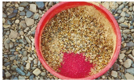
Futter mit Farbe: Die Mischung besteht aus Trockenfutter, Lebendködern und roten Futterpartikeln.

Ein Netz voller Nasen beweist: Die Taktik der beiden Profis ist voll aufgegangen.