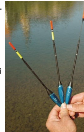
Waggler für besseren Lauf: Michael setzte auf einen Waggler aus der Genius 3-Serie.

Diese beiden Montagen benutzen unsere Experten beim Doppelmatch.