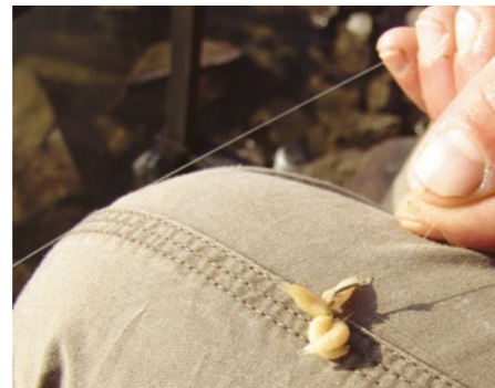
Barben lieben große Portionen. Deshalb wird der Haken gleich mit mehreren Maden bestückt.

W er im Fluss Barben fangen will, sollte nach der Wahl des Platzes nicht einfach drauflos angeln. Man muss erst einmal anfüttern, um die Fische an den Platz zu locken. Deshalb zeigt Michael Tanja erst einmal, welches Futter in der starken Strömung des Rheins zum Einsatz kommt, und wie man es anmischt. Michael schwört beim Anfüttern auf Maden. Eine Menge von 1,5 Liter reicht für einen Angeltag. Zuerst siebt Michael die Maden, um sie von den Sägespänen zu befreien. Dann werden sie mit einem Stoß aus der mit Wasser gefüllten Sprühflasche befeuchtet. Nun schüttet Michael 150 Milliliter Madenkleber ( Magic Gum von Mosella) hinzu. Damit die Maden zum Grund sinken, wo die Barben auf das Futter warten, verwendet Michael Kies mit einer Körnung von 3 Millimeter. Das Verhältnis von Kies zu Maden beträgt 2:1. Für 1,5 Liter Maden benötigt man also 3 Liter Kies. Auch der Kies wird befeuchtet und mit Madenkleber versehen (300 Milliliter). Dann schüttet Michael Krabblern und Kies zusammen. Um die Bindung zu verstärken, sollte man die Mischung verdichten. Dazu steigt Tanja in den Eimer. Schon ist die Barbentorte fertig.