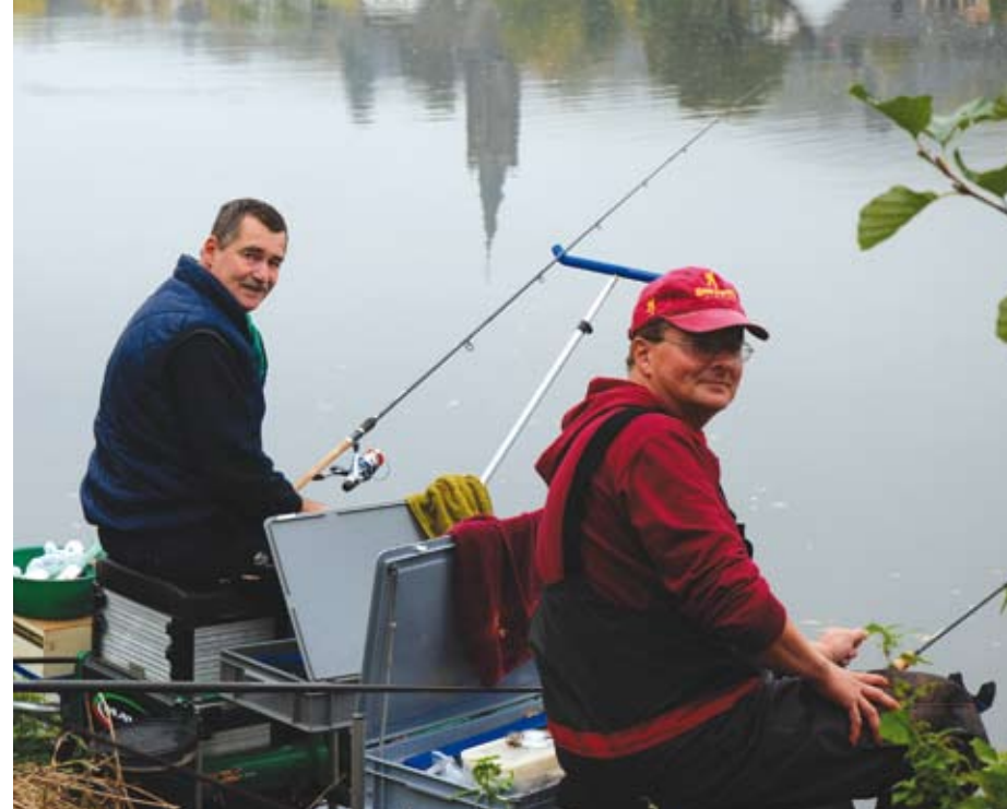
Mit einem Sektorensieg am zweiten Tag rutschte das Team Hackl/Artmann aus Österreich auf den 5. Platz