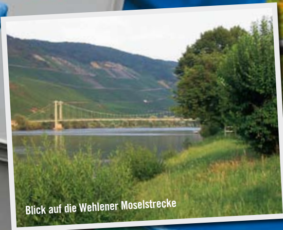
Blick auf die Wehlener Moselstrecke

Am Ende stand auch Zammataros Tandem Partner die Freude ins Gesicht geschrieben