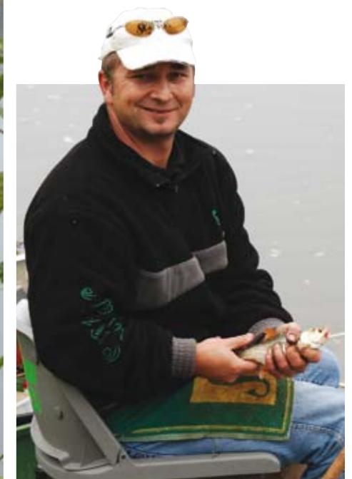
Geringe Fanggewichte sorgten für Freude über jeden einzelnen Fisch