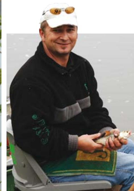
Geringe Fanggewichte sorgten für Freude über jeden einzelnen Fisch